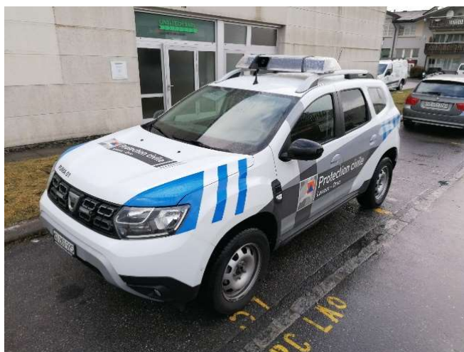
Dacia Duster : véhicule pour les officiers de piquets professionnels

Deux véhicules sont à présent dotés de signalétique faisant partie de l'identité visuelle de la Protection Civile. Nous nous réjouissons de pouvoir augmenter notre visibilité.