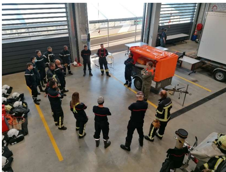
Présentation de notre remorque « biens culturels » au SDIS

Nous avons entretenu nos constructions (locaux à usage de la Protection Civile). Ceci a permis de rétablir le matériel, se réorganiser, et de procéder aux contrôles annuels faisant partie des tâches de la logistique.