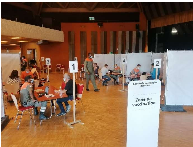
Centre de vaccination itinérant installé et exploité par les membres de la PC, ici à Savigny