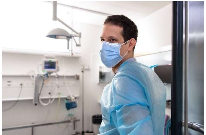
Désinfection de salles au CHUV